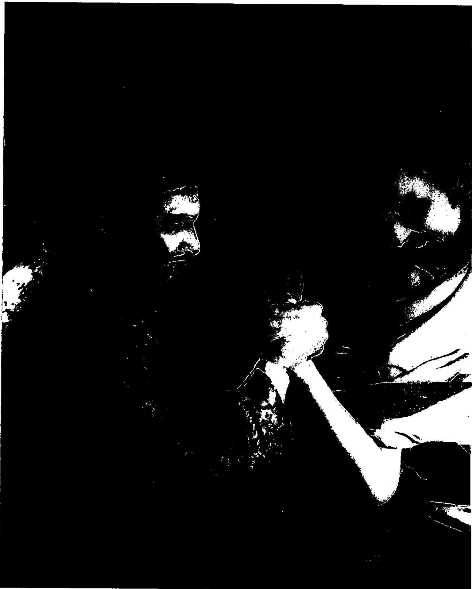
- CHARULATA -. DE SATYAJIT RAY (SAILEN MUKHERJEE ET SOUMITRA CHATTERJEE).